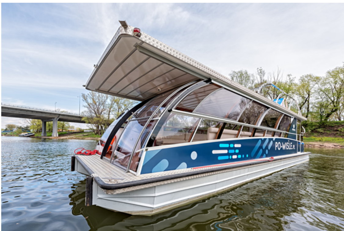
KROPKA I KRESKA, ilość osób: 12