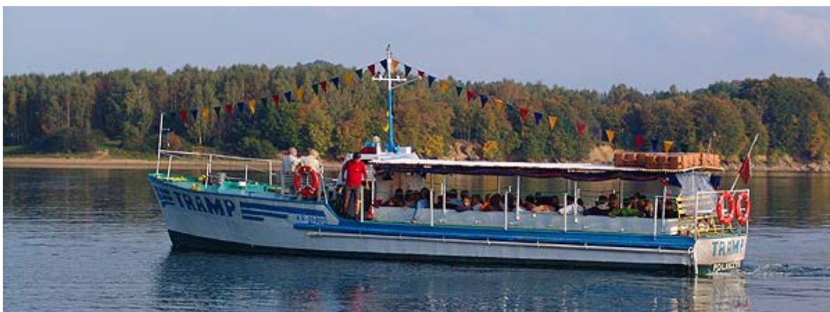
Solina Bieszczadzkie Morze

„TRAMP” w Polańczyku – Rejsy widokowe statkiem pasażerskim TRAMP – Statek spacerowy TRAMP to były okręt wojenny, który pływał po Morzu Bałtyckim i służył w Marynarce Wojennej. W 1994 r. został przebudowany na statek pasażerski. Przystań TRAMP znajdują się obok dawnej przystani ATRIUM. Statek płynie obok Wyspy Zajęczej, w kierunku zapory wodnej w Solinie, przepływa obok WZW „JAWOR”, Martwego Lasu i opływa Wyspę Skalistą. Podczas rejsu dwugodzinnego statek płynie dodatkowo obok zatoki Victoriniego, Drzewa Wisielca i wpływa do Zatoki Czarnej.