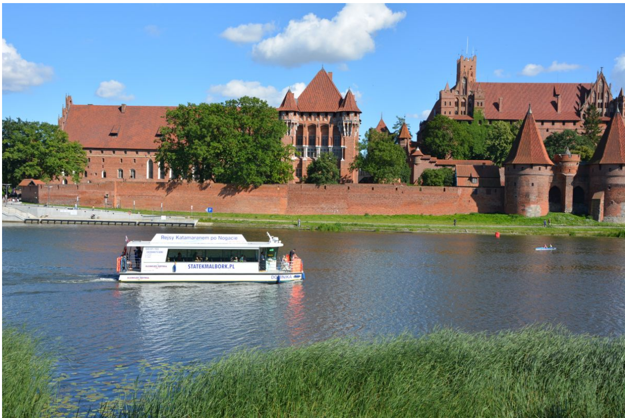
rejsy nowoczesnym katamaranem pasażerskim po rzece Nogat

Żegluga Augustowska; Kompleks jezior i rzek augustowskich, na których na początku XIX wieku został zaplanowany i zbudowany Kanał Augustowski, uznawany jest za jeden z najatrakcyjniejszych szlaków wodnych w Polsce, obok Wielkich Jezior Mazurskich. W ofercie Żeglugi Augustowskiej są rejsy trwające od 1,5h do 3h oraz rejsy na zamówienie. Pływać można obecnie na trzech statkach które zabierają od 100 do 330 osób. Najpopularniejsza trasa, to trasa zwana "papieską" od kiedy to na statku "Serwy" płynął papież Jan Paweł II. Po wypłynięciu z Portu Augustów, statek kieruje się wzdłuż rzek, śluz i jezior do jeziora Studzienicznego, gdzie statek zawija do miejscowości Studzieniczna, malowniczo położonej na półwyspie, miejsca kultu religijnego z wieloma zabytkami sakralnymi. Postój trwa około 20 minut a następnie statek płynie na powrót do Augustowa. Rejs trwa około 2,5 godziny. Statek- Katamaran SWOBODA to największy i najszybszy pasażerski statek śródlądowy w Polsce. Statek ma długość 40 metrów i blisko 6 metrów szerokości, może zabierać na pokład 330 osób. Statek „ SAJNO ”, 200 osobowy statek pasażerski, zabiera gości Żeglugi Augustowskiej w rejsy po Kanale Augustowskim i jeziorach Necko, Rospuda, Białe, Studzieniczne zgodnie z rozkładem rejsów.