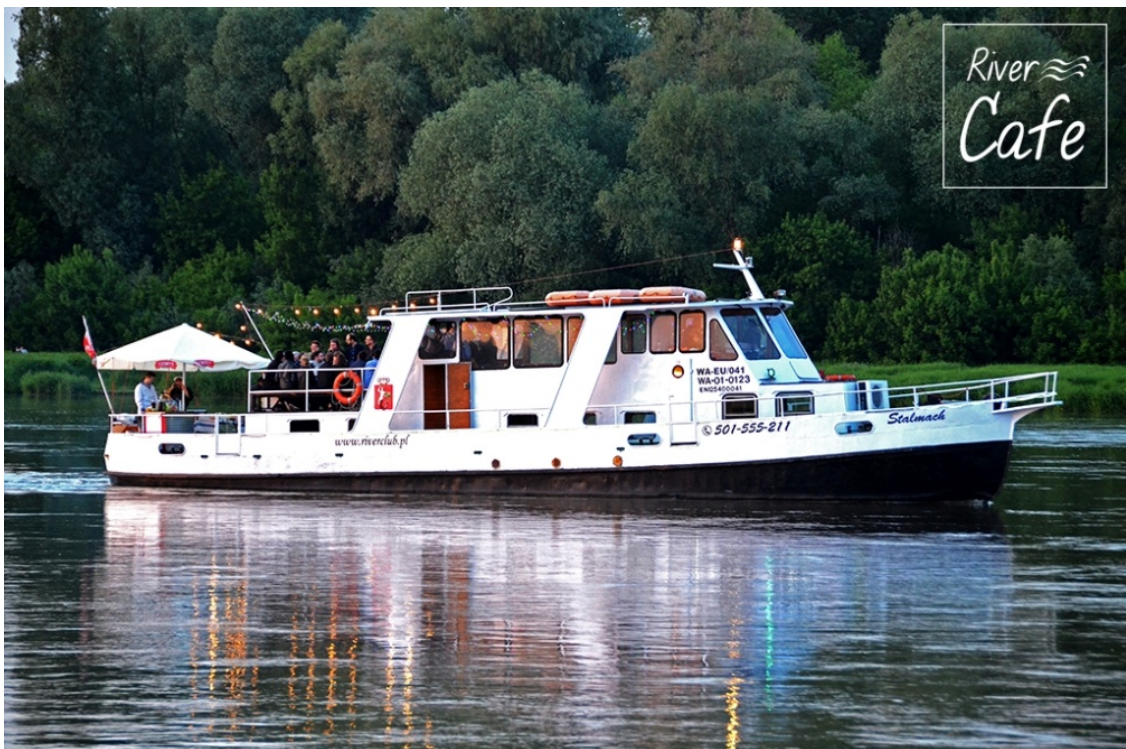
Statek „STALMACH” jest zarejestrowany na 50 osób